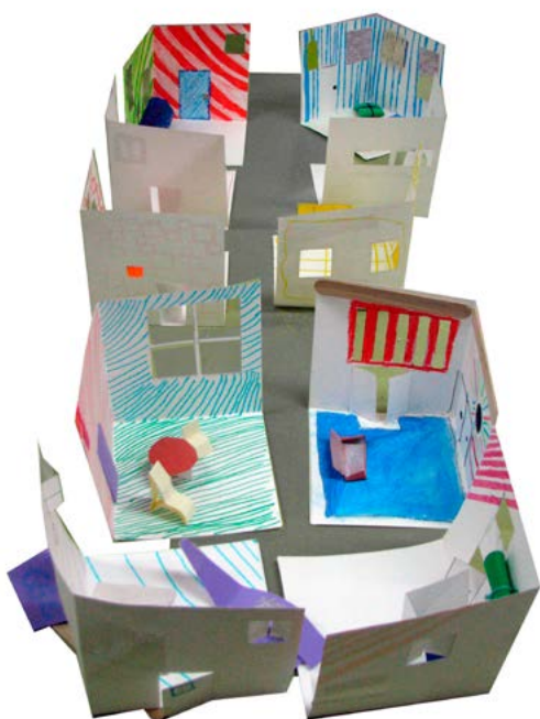
1, 2, 3, 4, 5 y 6: talleres de arquitectura y arte para niños

Organizada polo Colexio Oficial de Arquitectos de Galicia. Patrocinada polo Concello de Pontevedra e a Deputación de Pontevedra.